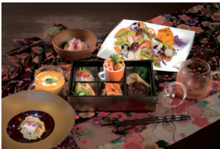
漿果 ~しょうか~ お一人様 3000 円(税込)