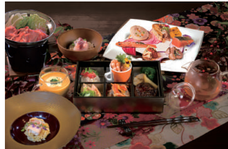
極 ~きわみ~ お一人様 5000 円(税込)